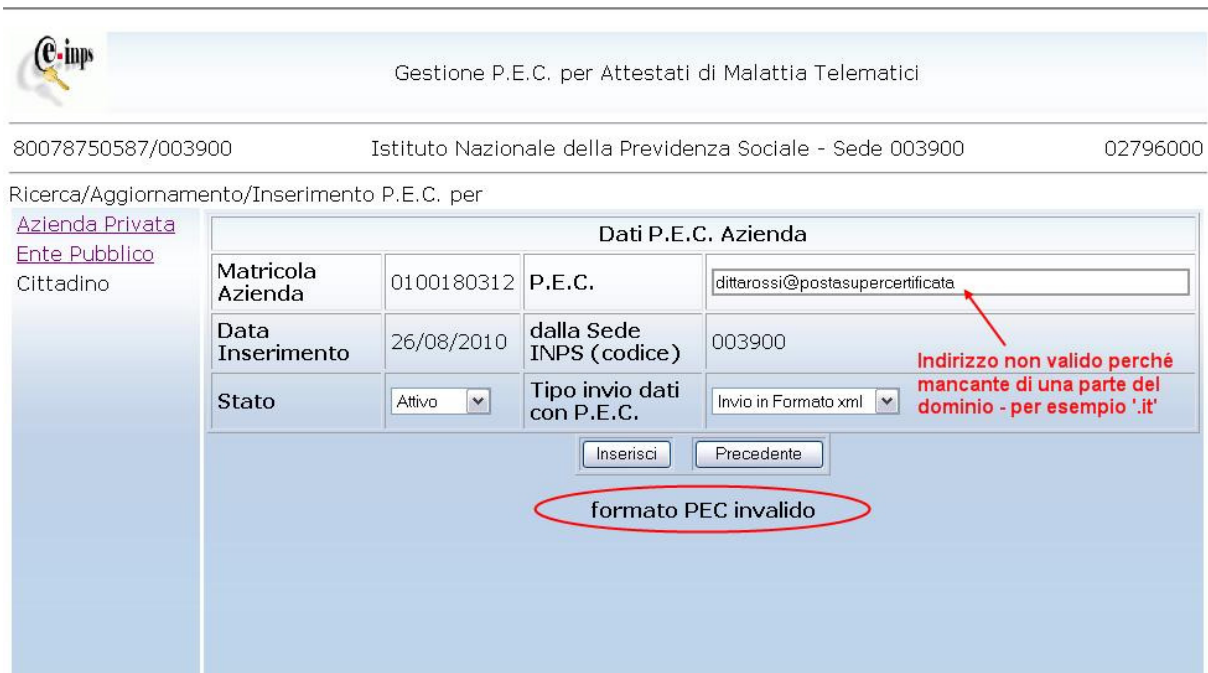
Figura 9. Messaggio formato PEC non valido

Invece, nel caso in cui l’indirizzo inserito non sia formalmente valido l’applicazione lo segnala con un messaggio: