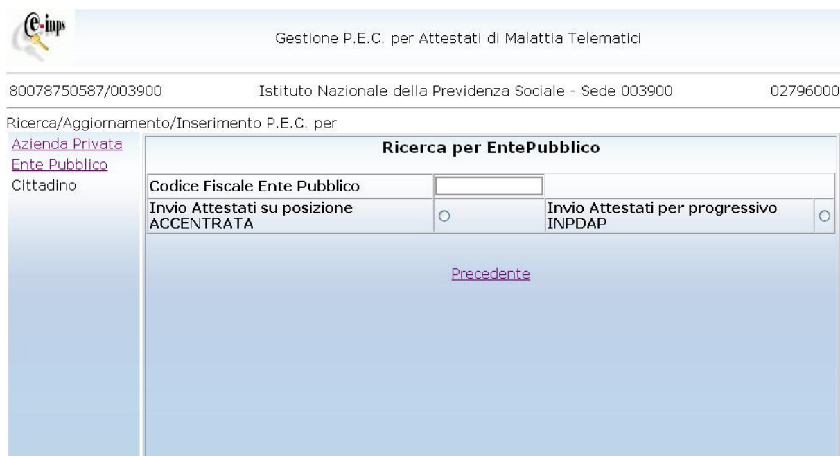
Figura 12. Ricerca per Ente Pubblico

‘Cliccando’ sulla voce Ente Pubblico si accede al seguente pannello.