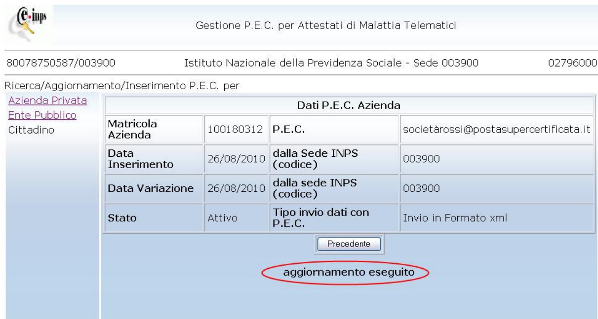
Figura 11. Risposta ad aggiornamento effettuato

Se l'indirizzo è formalmente valido l'applicazione restituirà un messaggio di conferma come alla successiva figura 11.