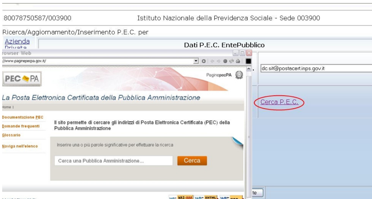
Figura 23. Link al sito P.E.C della P.A.

Cliccando su Cerca P.E.C. il sito si apre in una nuova finestra