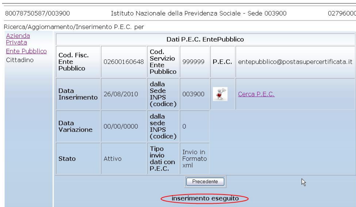
Figura 16. Risposta a inserimento effettuato

Se l'indirizzo è valido l'applicazione restituirà un messaggio di conferma come alla successiva figura 16: