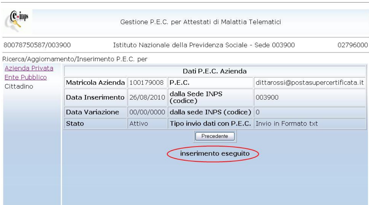
Figura 8. Risposta a inserimento effettuato

‘Cliccando’ sul tasto Precedente si torna al pannello Ricerca per Azienda e si può procedere ad un nuovo inserimento.