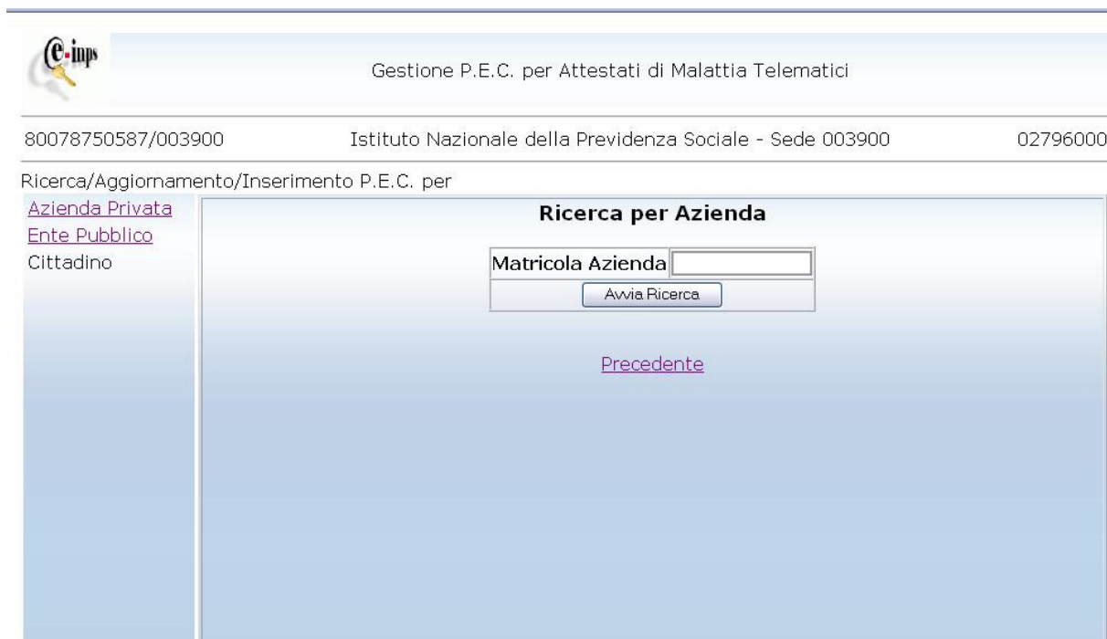
Figura 3. Ricerca per Azienda

‘Cliccando’ sulla voce Azienda Privata si accede al seguente pannello. Nell’apposito campo si scrive la matricola dell’azienda e si invia ‘cliccando’ sul tasto Avvia Ricerca